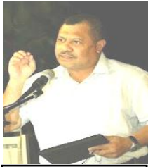
Renungan dari Meja